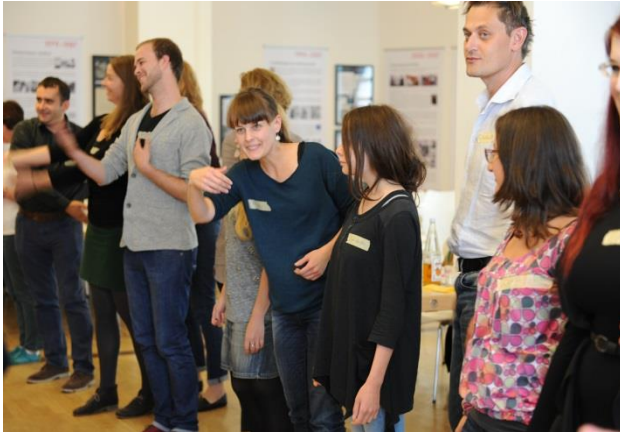
Radionica za prezentaciju i moderaciju, Stuttgart 2014.