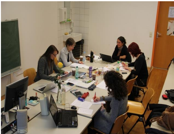
Radionica slovensko-njemačka grupa, Graz, jesen 2013

Radne grupe su se tijekom projekta tri puta srele na radionicama s prisutnošću svih sudionika i osim toga su provodili online-savjetovanja kako bi razgovarali o svojim prijevodima. Cilj tih radionica bio je obrazovati buduće prevoditeljice i prevoditelje u književnom prevođenju i zajedničkom radu na prijevodu u skupinama. Uz rad koji se odvijao u jezično uparenim grupama, sudionici su se sastajali i timske radionice na kojima su komplementarne grupe radile na tekstovima zajednički. Osim seminarskih radionica, sudionice i sudionici projekta radili su na svojim tekstovima i samostalno, a podržavao ih je mentor i ostali sudionici njihove skupine.